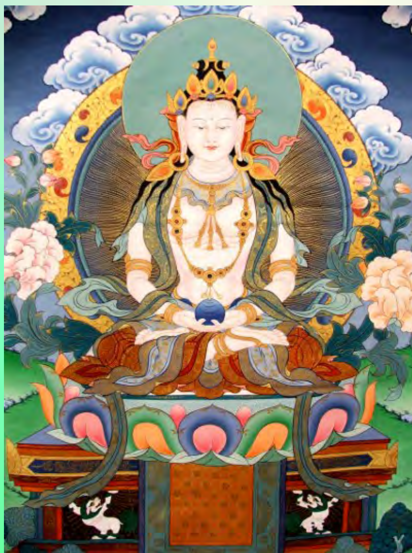
Shen Lha Ökar

Vor langer Zeit gab es in einem Teil des Himmels, genannt Sidpa Yesang, drei Brüder namens Dakpa, Salwa und Shepa. Ihr Vater war Sidpa Triöd und ihre Mutter war Kunshe. Diese Brüder studierte bei einem großen Lehrer namens Tobumtri Log Gi Che Chen. Nach Abschluss ihres Studiums gingen sie zu Shen Lha Ökar, dem Erleuchteten des Mitgefühls und fragten, wie sie die größte Hilfe bei der Befreiung der fühlenden Wesen aus dem Leiden der zyklischen Welt sein könnten. Er riet ihnen, eine menschliche Geburt in drei verschiedenen Altersklassen anzunehmen, so dass jeder Bruder helfen könnte, für die Lebewesen in diesem jeweiligen Alter, die Befreiung zu erreichen. Auf Shen Lha Ökar's Rat hin wurde der ältere Bruder als Lehrer in der Vergangenheit geboren und hatte den Namen Tönpa Togyal Ye Khyen . Der zweite Sohn, Salwa, wurde in dem jetzigen Zeitalter als Tönpa Shenrab geboren. Shepa wird in der Zukunft als Thangma Medon geboren werden.