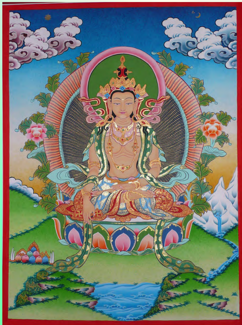
Tönpa Shenrab Miwo

Nach unserer Tradition existiert die Bön-Religion seit 18.000 Jahren in dieser Welt. Yungdrung Bön entstand aus den Lehren von Tönpa Shenrab in Olmo Lung Ring. Von dort wurden die Lehren in Zhang Zhung verbreitet und von dort aus in die meisten der asiatischen Länder.